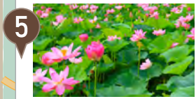
5 蓮池 7~8月が見頃です◆徒歩8分