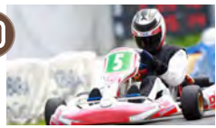
10 茂原ツインサーキット 本格的なモータースポーツ◆車5分