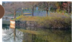
8 八幡湖 のどかな散歩コース◆徒歩8分