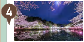
4 茂原公園 日本さくら名所に選出◆車16分