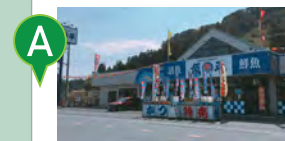
A 海鮮市場 魚平 海鮮がオススメ◆車で約20分