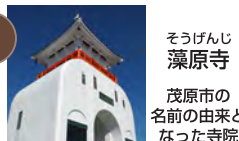
9 そうげんじ 藻原寺 茂原市の 名前の由来と なった寺院 車12分