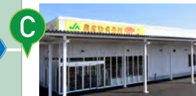
C JA 長生 ながいき市場 新鮮野菜多数! ◆車で約15分