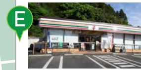
E セブンイレブン茂原上永吉店 徒歩20分、車5分