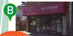
B 超おすすめ! 緑川肉店 新鮮な精肉◆車で約13分