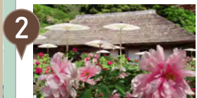
2 茂原牡丹園 牡丹と芍薬が咲き誇る◆車15分