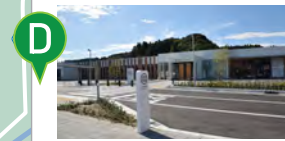
D 道の駅むつざわ つどいの郷 直売+温泉もあり◆車で約10分