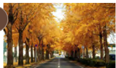
7 富士見公園 銀杏並木 黄金に輝く銀杏並木◆車16分