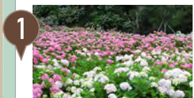
1 服部農園あじさい屋敷 数多くの紫陽花◆徒歩20分、車3分